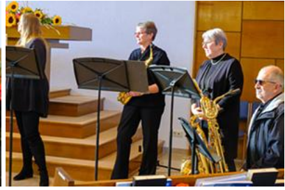
Benefizkonzert zu Erntedank für Hammer Tafel