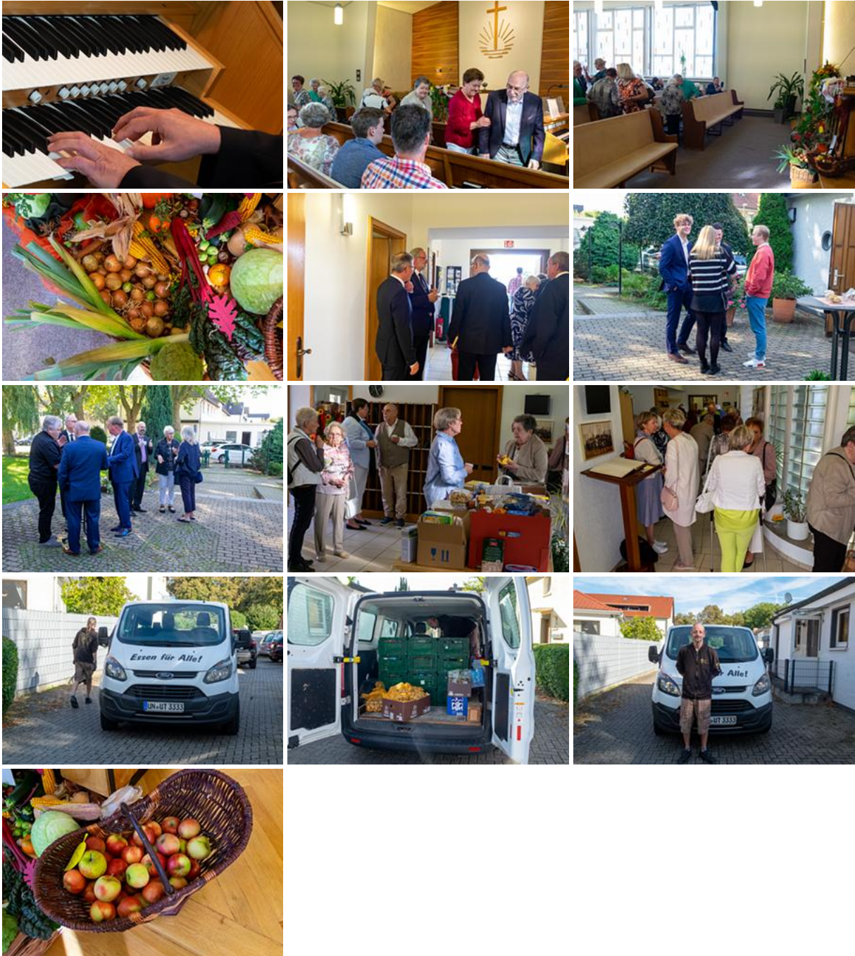
Ein fröhlicher Kürbis zaubert ein Lächeln ins Gesicht - Tafelspende und Fingerfood-Brunch runden das Fest ab